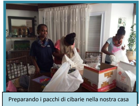
Preparando i pacchi di cibarie nella nostra casa

preparate, danze e musica) per due gruppi di sopravvissuti all'Olocausto. In questo modo e con molti piccoli regali, gli amici corani hanno espresso il loro amore per Israele e la sua gente. Come NPO (associazione senza profitto) ci siamo uniti al progetto della Pasqua cittadina, portando pacchi di cibarie alle famiglie in bisogno. Ci piacerebbe lavorare più strettamente con la città, ma è molto difficile; molti progetti si arenano perché i nostri contatti nel municipio sono stati pigri nel prendere sul serio i progetti. Si parla tanto, ma con pochi risultati. Preghiamo che al tempo giusto possiamo incontrarci e metterci in contatto con persone con cui poter lavorare seriamente.