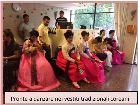
Pronte a danzare nei vestiti tradizionali coreani